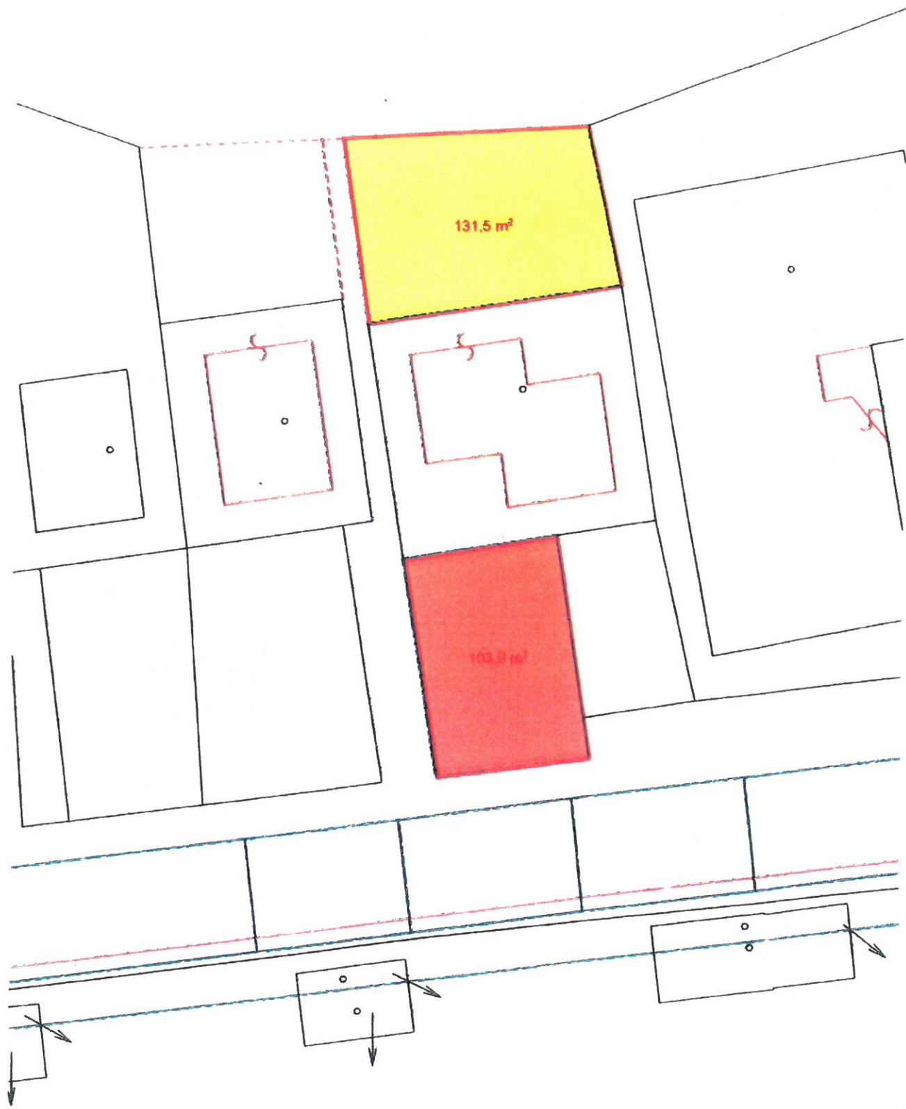
GRAFICKÝ NÁČRT: PRÍLOHA Č. 2 - GAŽO