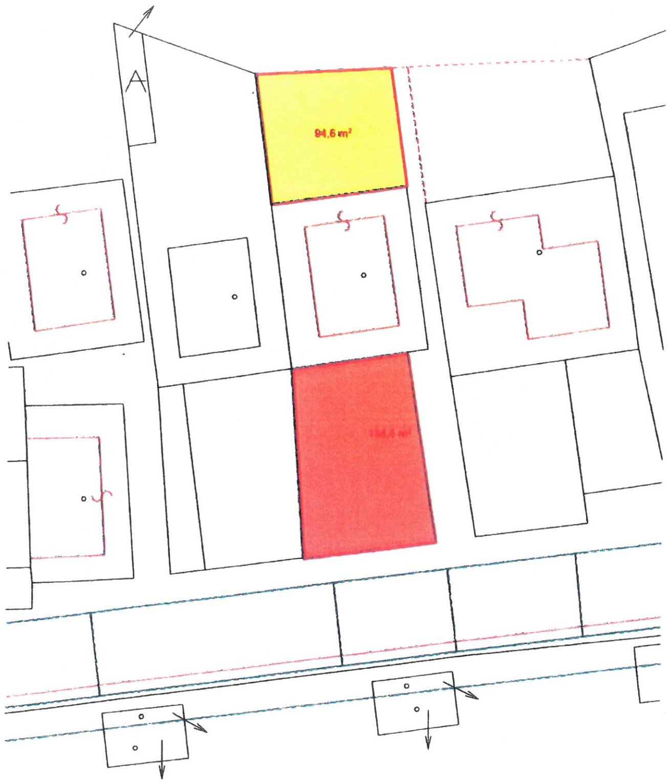
GRAFICKÝ NÁČRT: PRÍLOHA Č.3 - BUCH