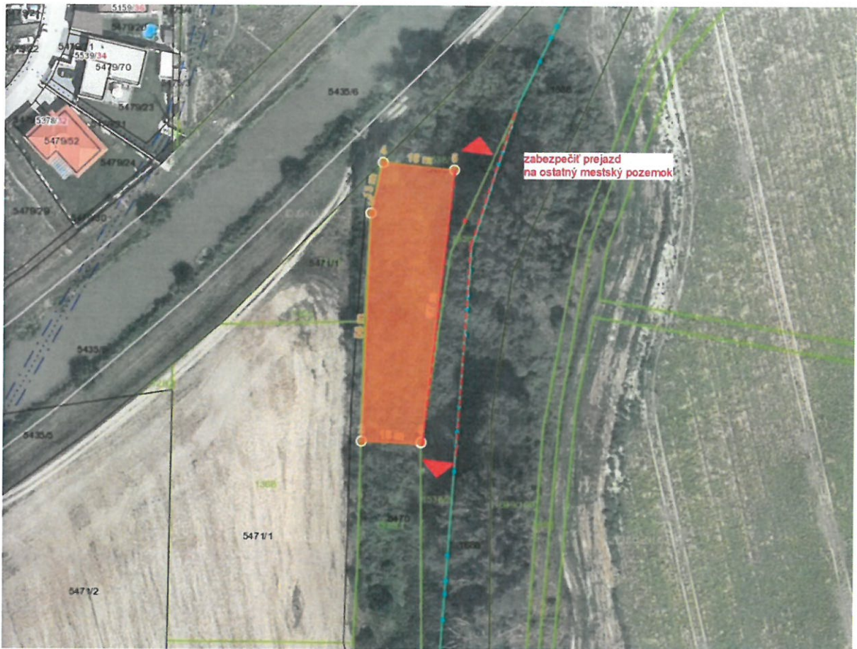
náčrt komisie k uzneseniu 16/2023

Návrh uznesenia 16/2023 „Komisia návrh prenájmu odporúča podľa náčrtu komisie, s ponechaním prístupu k meandru s realizáciou dočasného oplotenia“