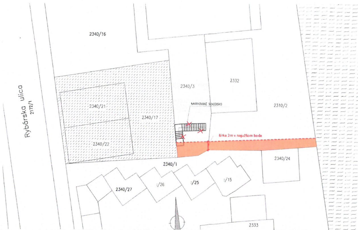
náčrt komisie k uzneseniu 15/2023

Návrh uznesenia 15/2023 „Komisia návrh prenájmu pozemku odporúča vo výmere podľa náčrtu komisie, bez možnosti oplotenia prenajatej plochy a s realizáciou ľahkej konštrukcie schodiska, ktoré po vypovedaní nájomnej zmluvy musí žiadateľ odstrániť“