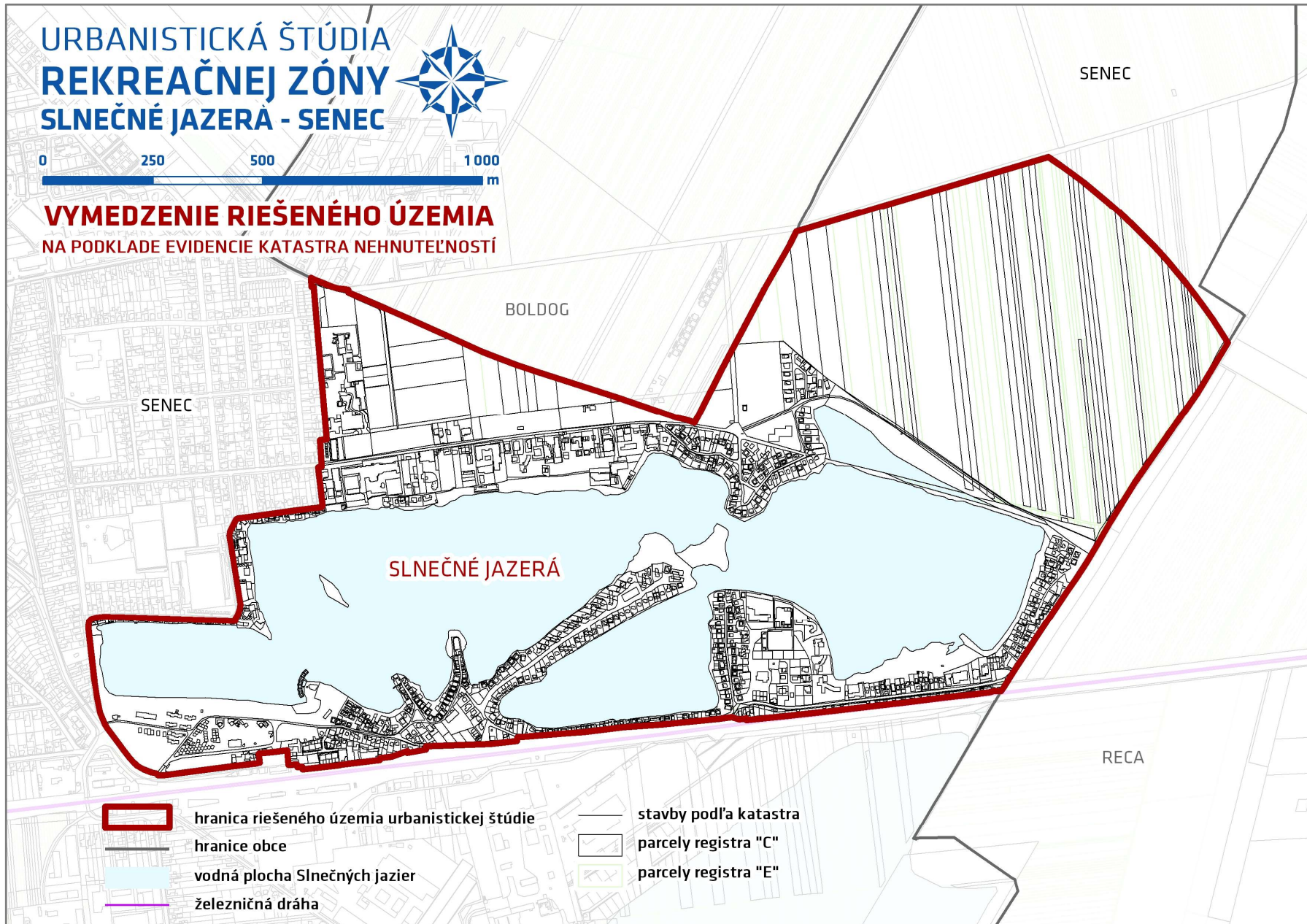
SCHÉMA: VYMEDZENIE RIEŠENÉHO ÚZEMIA NA PODKLADE KATASTRA NEHNUTEĽNOSTÍ