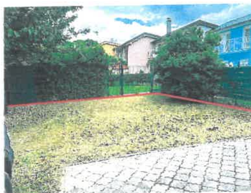
Záhradka - novovzniknutá parc. č. 2587/75