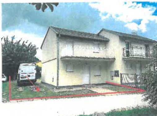
Západný pohľad z príjazdovej komunikácie

Pozemok parc. č. 2587/75, k.ú. Senec, Slnčné jazerá č. 3072, Senec