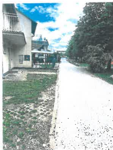
Príjazdová komunikácia parc. č. 2552/1