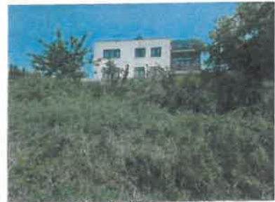
RD na p.č.5325/21