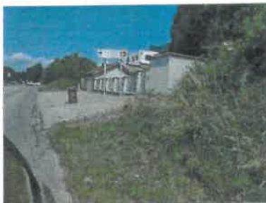
pohľad z Pezinskej ulice