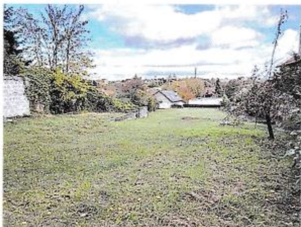
Ohodnocované pozemky parc. č. 158, 159