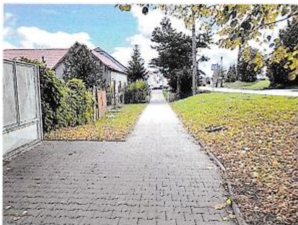
Pohľad na prístupovú komunikáciu