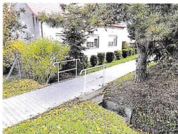
Mostík cez odvodňovací kanál, ktorý vedie pozdĺž juhovýchodnej hranice pozemkov parc. č. 158, 159