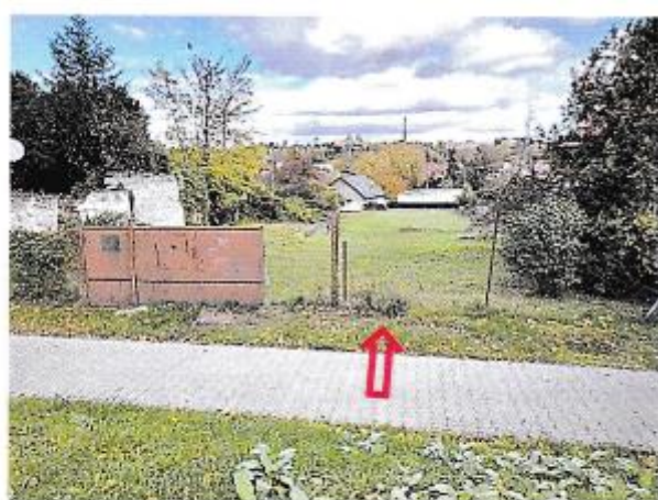
Pohľad na pozemky parc. č. 158, 159 od ulice Chorvátska